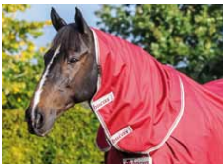
Select Combi Neck: wasserdichtes Halsteil... ... auch als Indoor-Variante