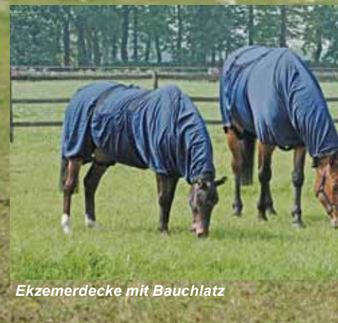
Ekzemerdecke mit Bauchlatz