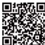
Horseware Rambo Sweetitch Hoody Pony Reißfeste Pony Ekzemerdecke mit sehr engmaschigem und atmungsaktivem Gewebe für sicheren Schutz vor Plagegeistern.