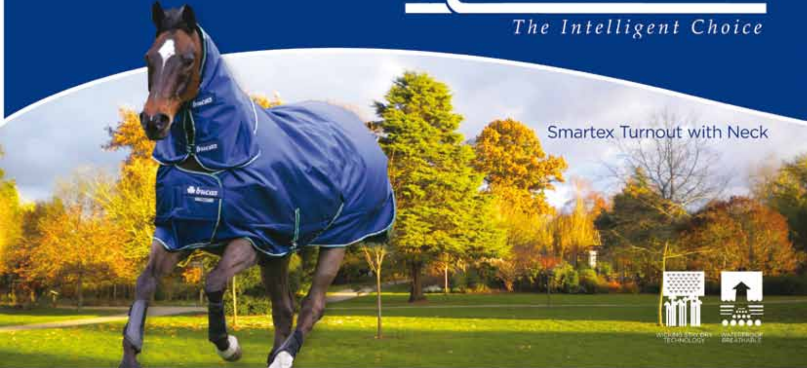
Smartex Turnout with Neck