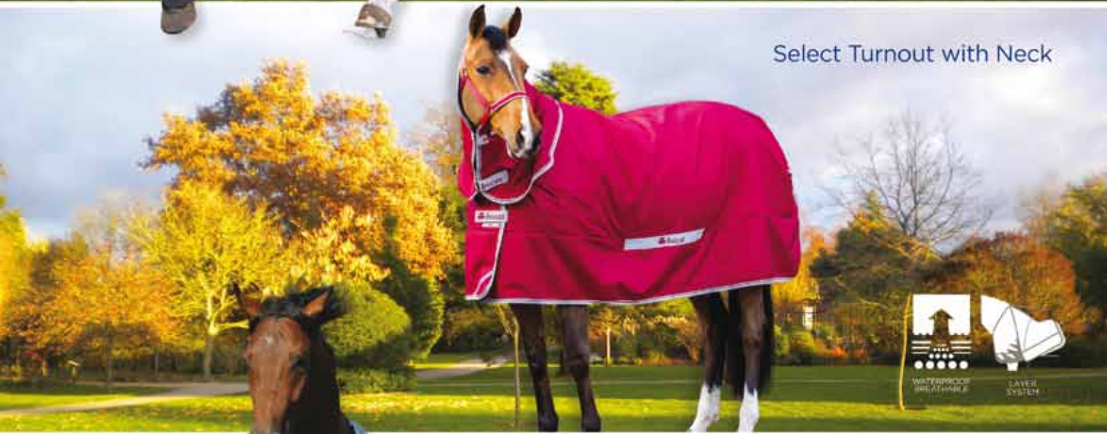
Select Turnout with Neck