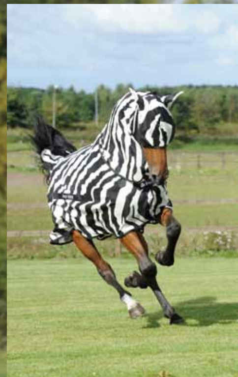
Zebra-Look als perfekte Tarnung

Wichtig ist, dass die Fliegenmaske eng anliegt und Abnäher im Augenbereich haben, damit die Maske nicht aufliegt. Die Fliegenmaske ist so konstruiert, dass sie am Pferdekopf einen sicheren Sitz hat.