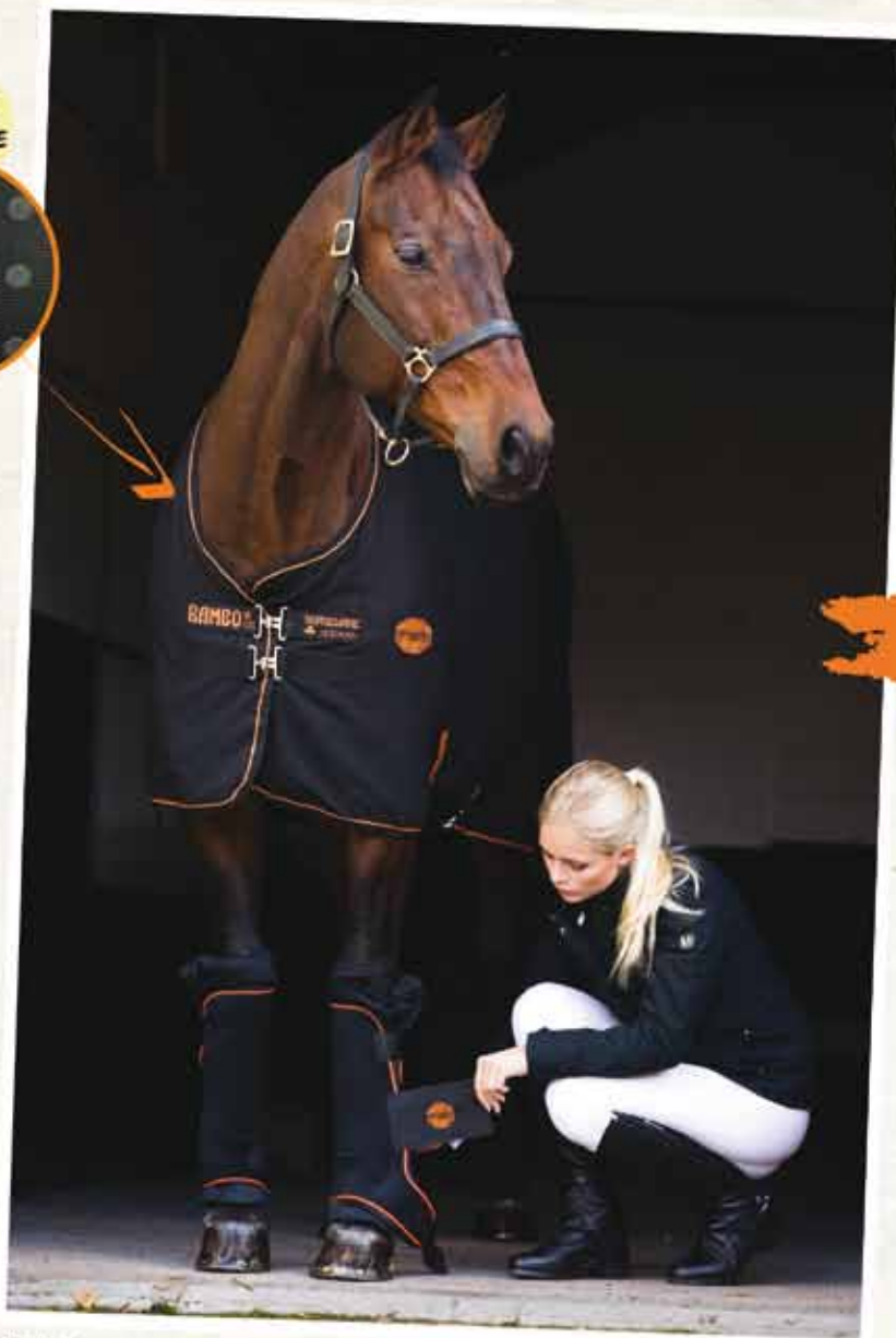
Rambo® Ionic Stable Sheet