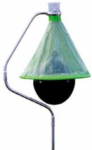
BUSSE Bremsenfalle FLY-STOP

Mit diesen wirksamen Hilfsmitteln können Pferd und Reiter auch in den warmen Monaten die Zeit an der frischen Luft genießen.