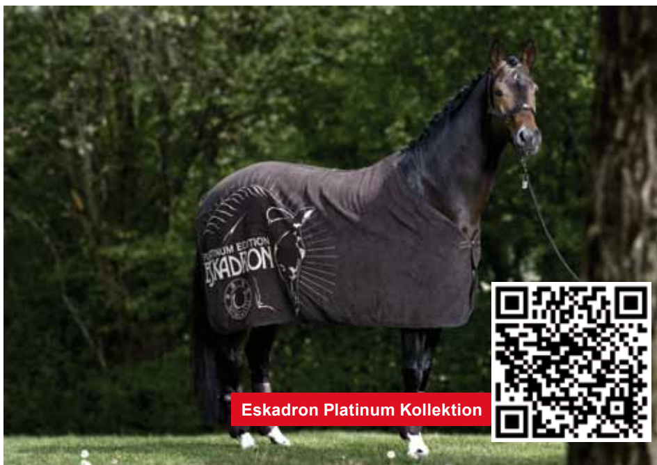
Eskadron Platinum Kollektion

Passion in Equitation: Eskadron Pferdedecken haben eine perfekte Passform, verwenden hochfunktionale Stofftechnologien und setzen modische Impulse.