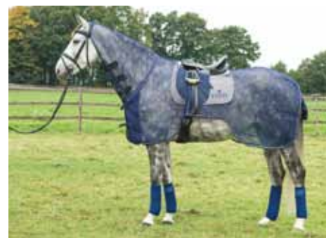
Fliegenausreitdecke mit Sattelausschnitt