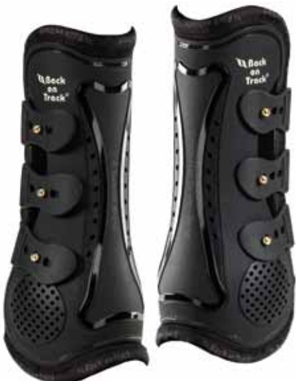
Back on Track Royal Work Boots

Die Back on Track Gamaschen sind sehr leicht in der Handhabung: mit elastischen Schnellverschlüssen können sie bequem am Pferdebein angebracht werden.