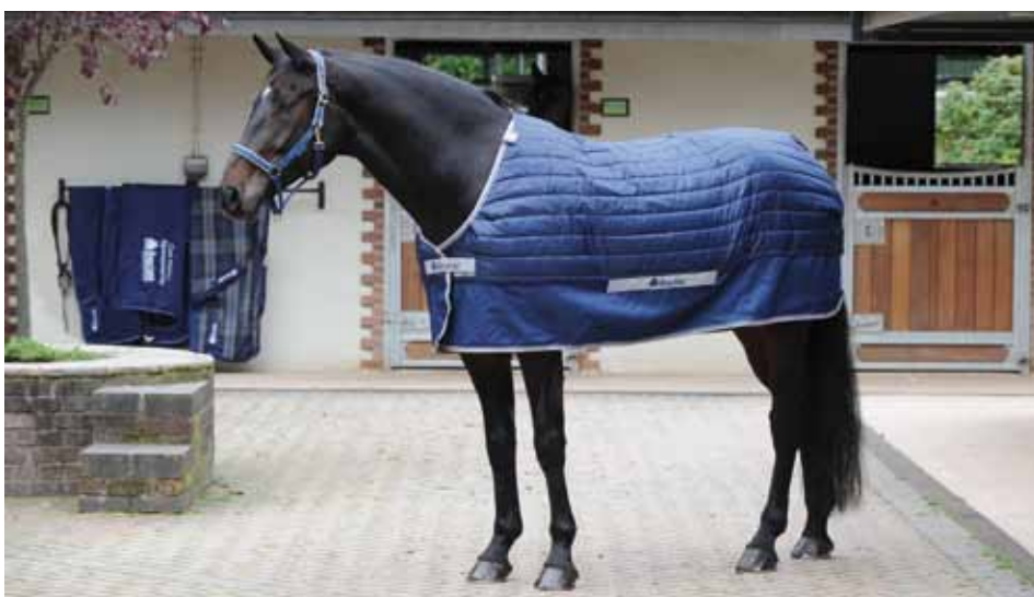
Select Under Rug: Unterdecke (150g oder 300g), auch mit Abschwitzfunktion