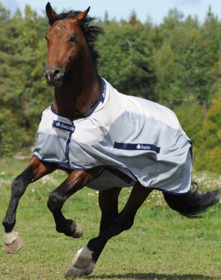
Fliegendecke mit integriertem Regenschutz

Sie wird nicht am Halsteil befestigt, damit beim Hängenbleiben nicht gleich die ganze Decke beschädigt wird und sich das Pferd nicht verletzen kann.