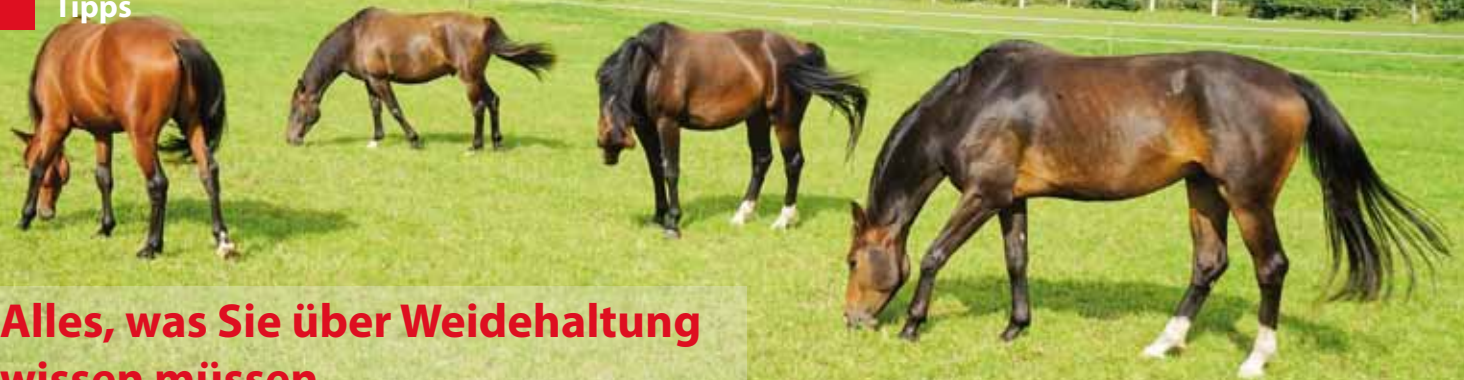
Foto: Pferde auf einer Pferdekoppel, Breitbild