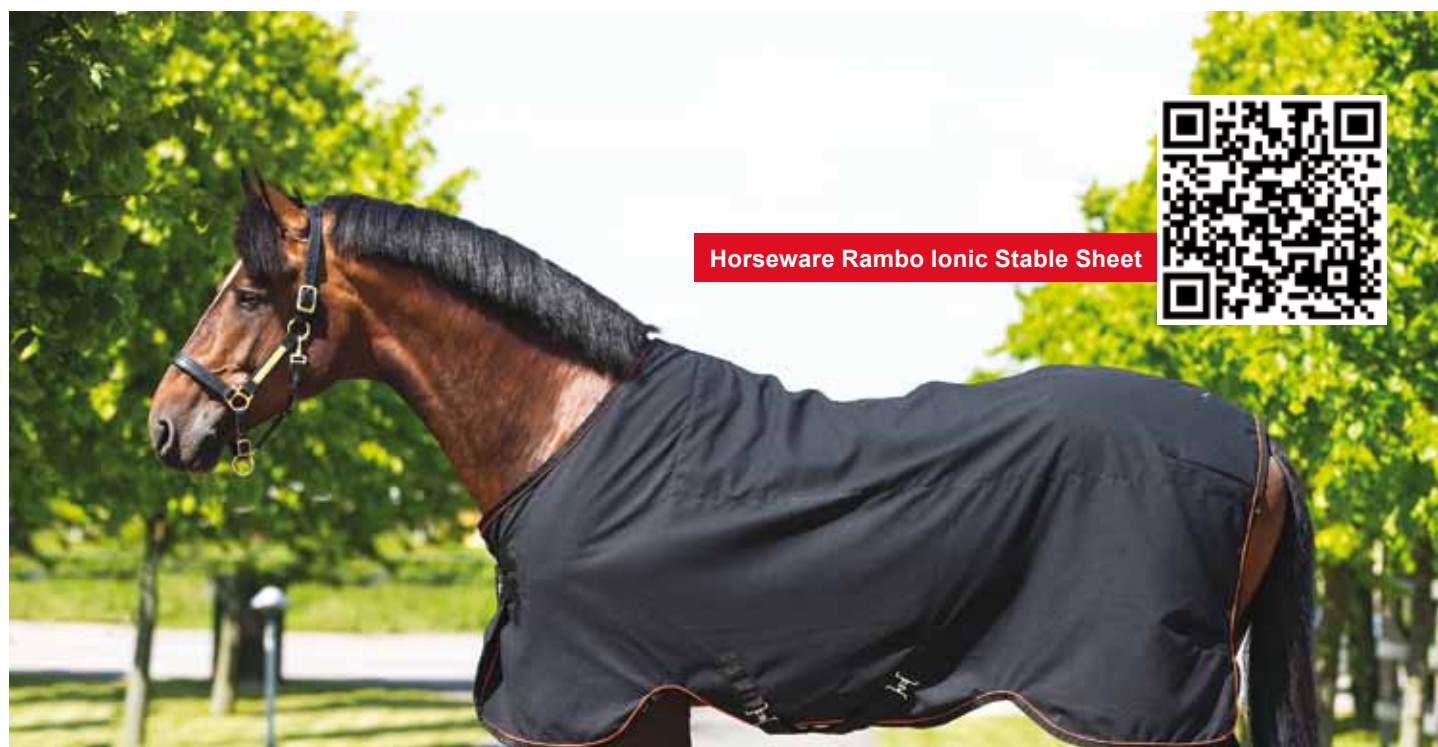
Horseware Rambo Ionic Stable Sheet