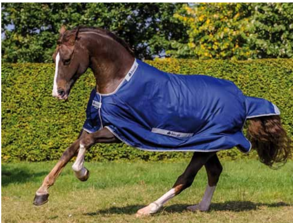
Select Turnout: leichte, ungefütterte Weidedecke

QR-Code scannen und direkt zu den Produkten gelangen.