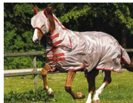
Rundum-Schutz mit Halsteil & Fliegenmaske