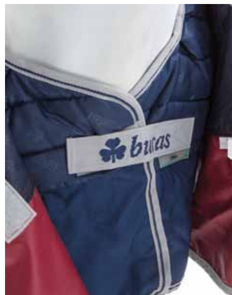
Kinderleichte Anbringung mit Klettverschluss und Metallösen