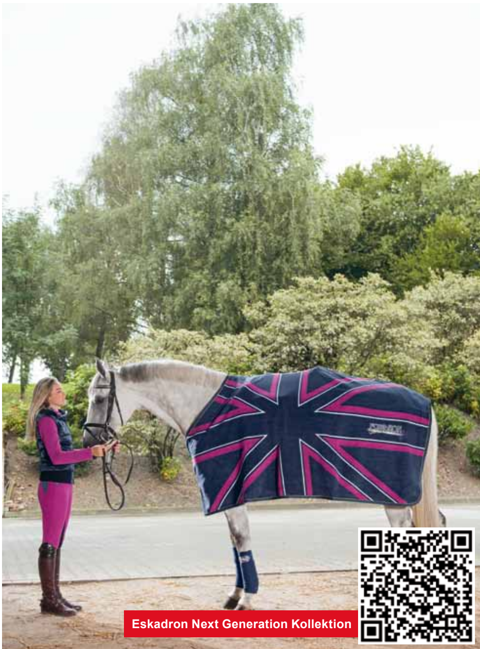
Eskadron Next Generation Kollektion