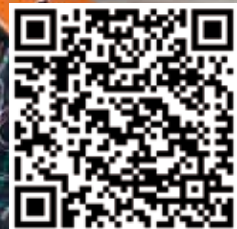
Eskadron Classic Sports Kollektion