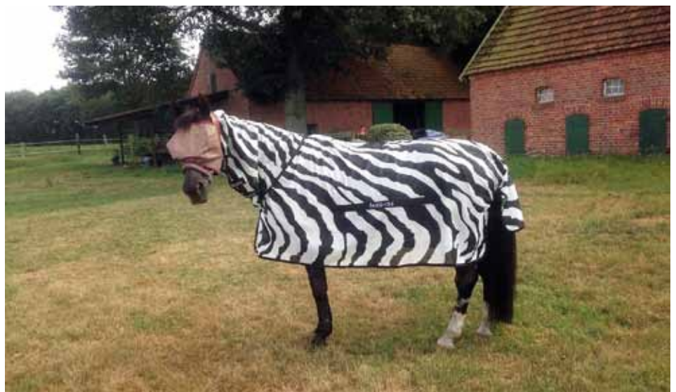
Zebra-Decke von Bucas im Einsatz - Foto: Tanja-Müschke