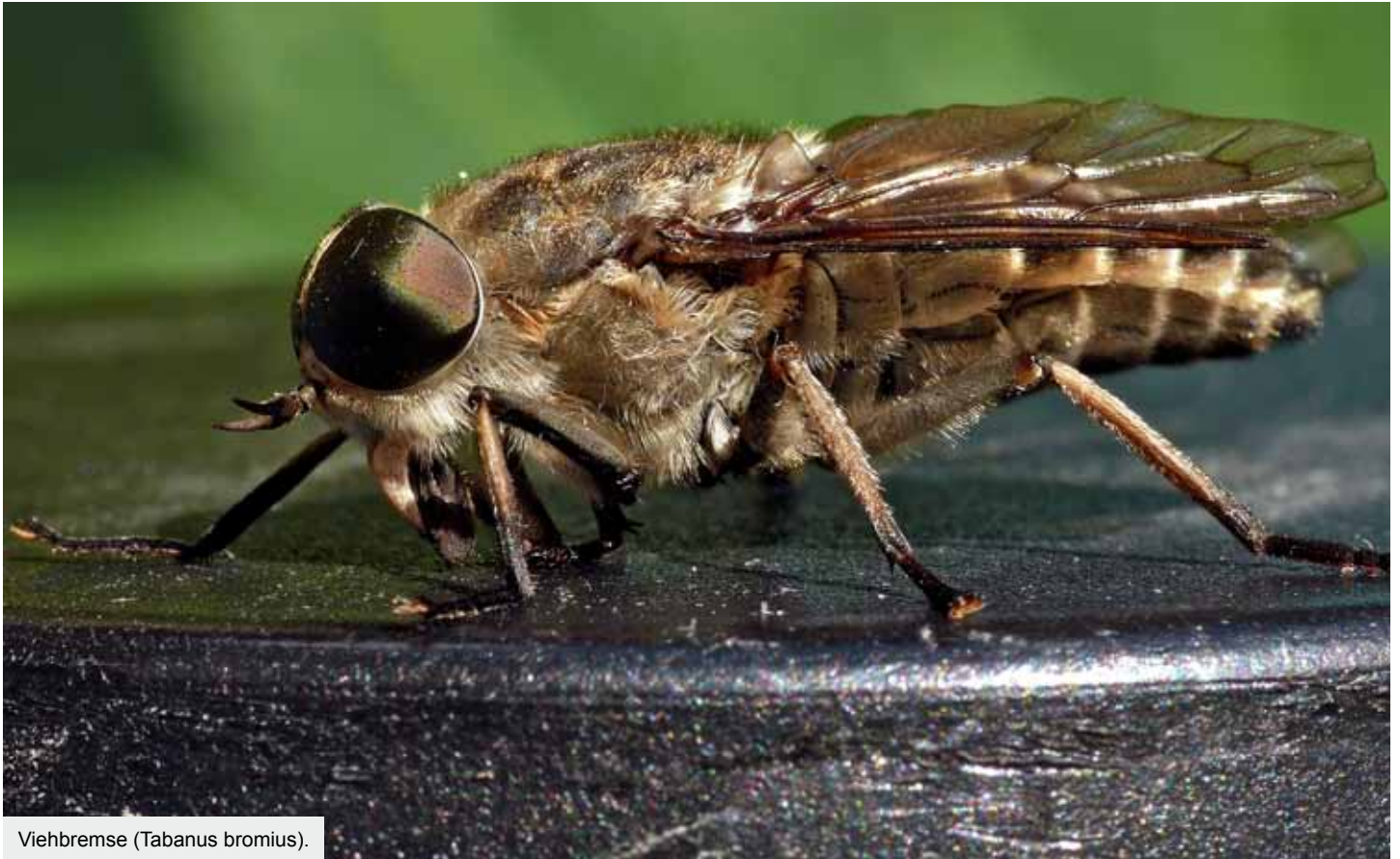
Viehbremse (Tabanus bromius).