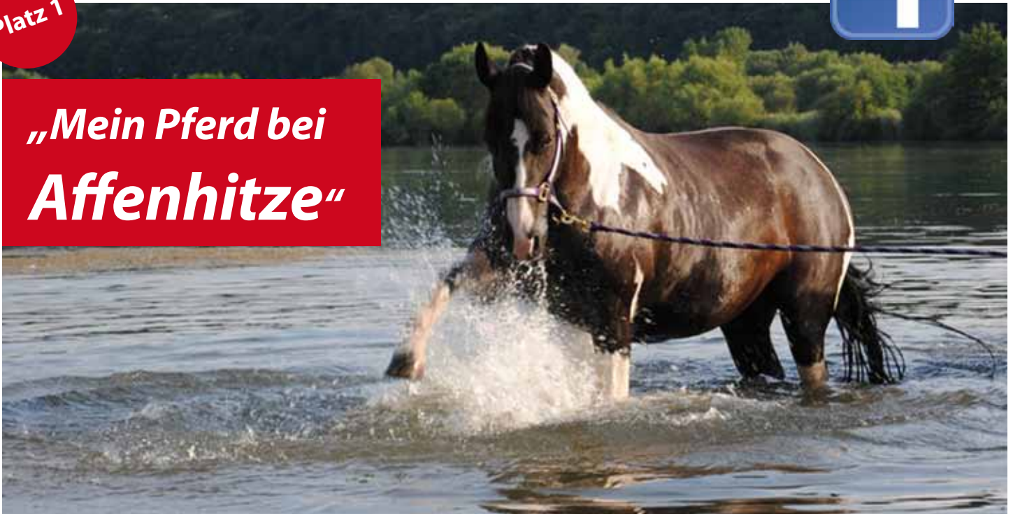
Platz 1: Badespaß bei Sommerhitze: Die 14-jährige Paintstute Walhalla im Stettfelder Baggersee.

Sonnenanbeter kamen 2013 voll auf ihre Kosten. Der Sommer letztes Jahr hatte so viele Sonnenstunden wie schon lange nicht mehr. Juni, Juli und August: Nahezu in allen drei Monaten hatten die Deutschen allerbestes Urlaubswetter daheim. Selbst der September war noch überdurchschnittlich freundlich.