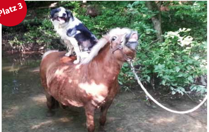
Fast wie bei den Bremer Stadtmusikanten: Fehlen nur noch Katze und Hahn. In diesem Fall ist der Esel natürlich ein Pferd. - von Verena Laufer -