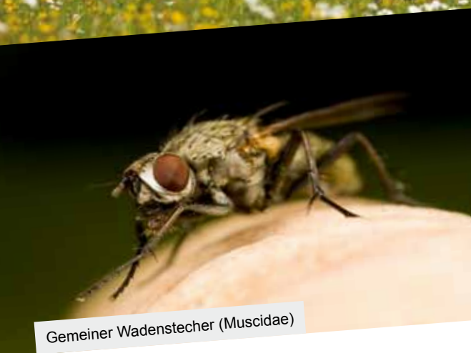
Gemeiner Wadenstecher (Muscidae)