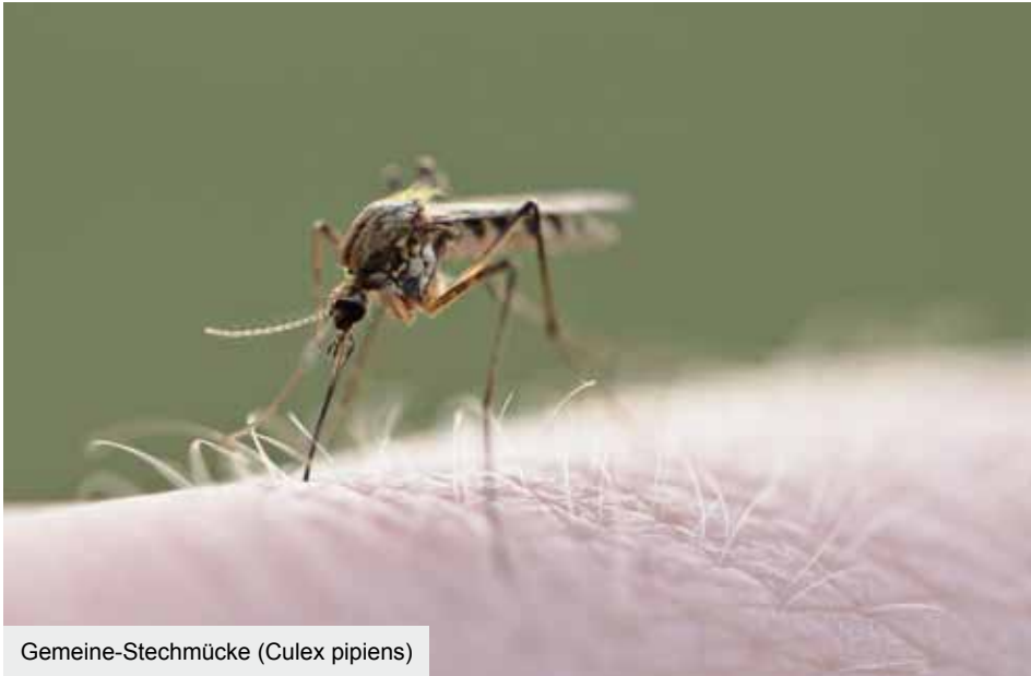
Gemeine-Stechmücke (Culex pipiens)

Zur Linderung von Sommerexzem und zum Schutz vor weiterer Ausbreitungen gibt es Ekzemerdecken. Die Decken werden möglichst durchgängig getragen, schützen vor Insektenstichen und verhindern, dass das Pferd sich an den betroffenen Stellen scheuern kann. Durch den eingearbeiteten UV-Schutz wird zudem die hautschädliche Sonnenbestrahlung vermieden.